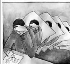
Study (art) copy work

Anyone who has studied, usually just with the computer (and) and grown accustomed to using the Internet (intensively) - even doing research for seminar papers and theses. That paper appears on the Internet (these students often have) available documents related articles such as the one who discovered it. For some, there is a certain temptation for academic these texts or passages from the net to be copied without a source. This is not a harmless if may sound. Because plagiarism is not only a scientifically dubious, they are punishable under criminal law.