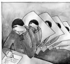
Study (art) in copy work.

Anyone who has studied, usually just with the computer (and) and grown accustomed to using the Internet (intensively) - even doing research for seminar papers and theses. That paper appears on the Internet these students often have a certain opinion on related articles such as the one who discovered it. For some there is a certain temptation for academic these texts or passages from the net to be copied without a source. This is not a harmless if may sound. Because plagiarism is not only a scientifically dubious, they are punishable under criminal law.